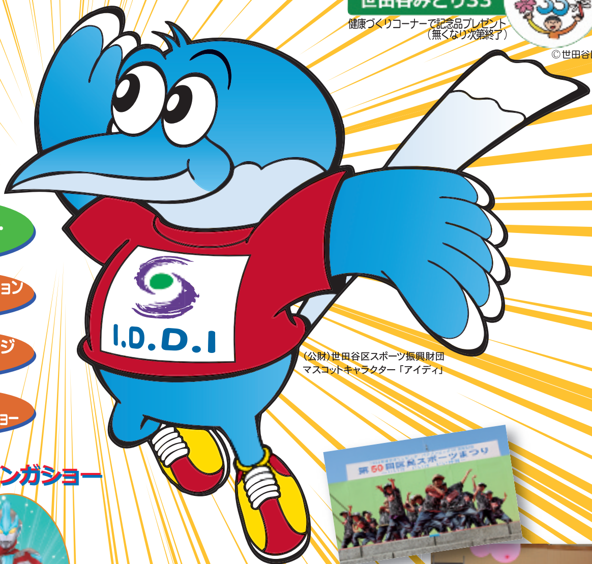
(公財)世田谷区スポーツ振興財団 マスコットキャラクター「アイディ」